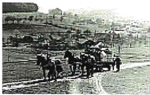
Kehrichtabfuhr mit Pferdegespann im Jahr 1940 (aus Fotoarchiv der Gemeinde Lotzwil)